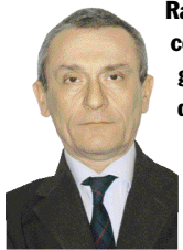
Raffaele Sirica, con il suo impegno alla guida del Cnappc, ha contribuito a valorizzare la figura professionale dell'architetto anche al di fuori del mondo degli addetti ai lavori. Come pensa di gestire il periodo «di transizione» fino alle prossime elezioni, a fine 2010?

Dopo la prematura scomparsa di Raffaele Sirica, il Consiglio nazionale andrà avanti nel percorso di riforma interna e valorizzazione della professione